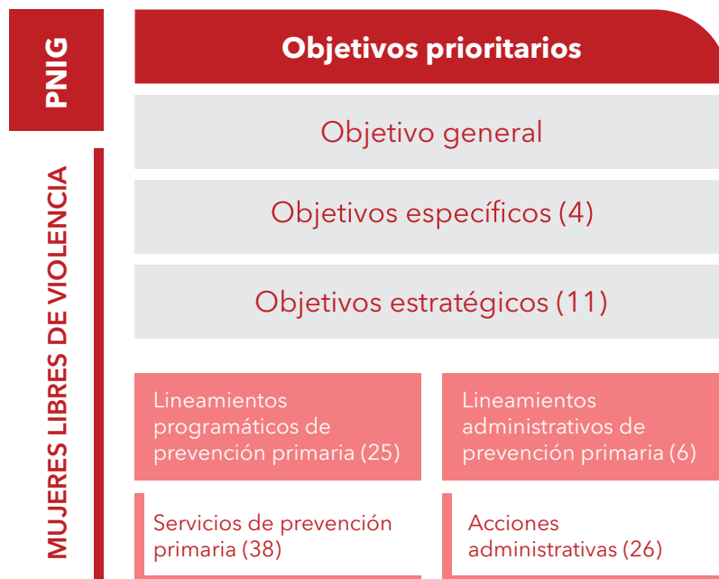
Figura 3. Lógica estratégica