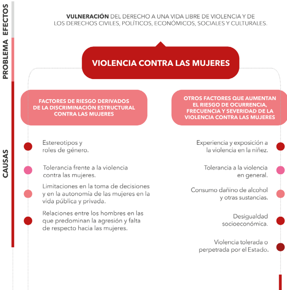
Figura 1. Factores riesgo de la violencia de género contra las mujeres