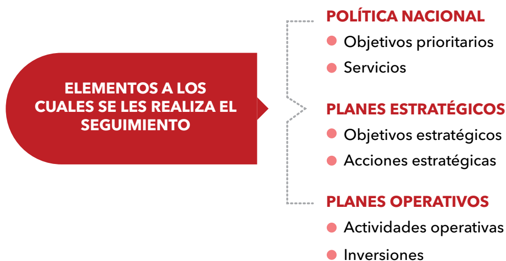
Figura 4. Seguimiento de la Estrategia Nacional